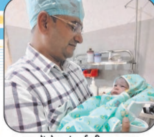
बच्चों के संपूर्ण टीकाकरण की सुविधा उपलब्ध