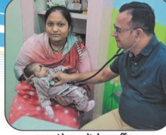
24 घंटे बच्चों के भर्ती व आपातकालीन इलाज