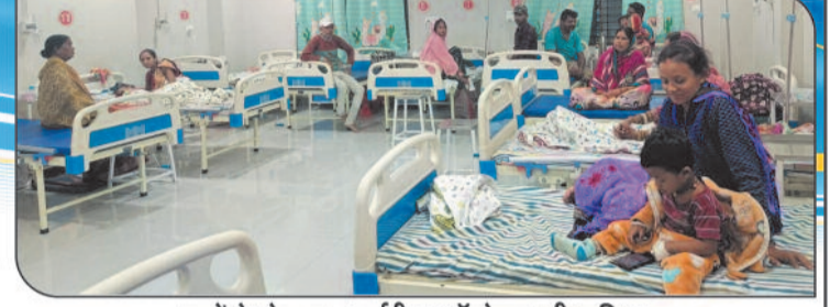
बच्चों के फ्रेक्चर, सर्जरी व ऑपरेशन की सुविधा सोनोग्राफी, एक्सरे एवं सभी प्रकार के पैथालॉजी जांच सुविधा उपलब्ध