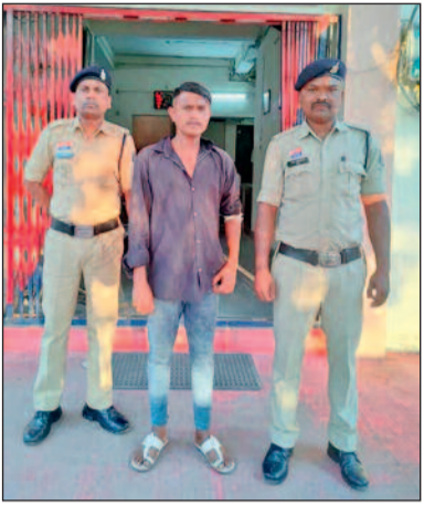
कुछ लोग मौके से भाग गए। वहीं मौके पर मौजूद दो संदेहियों को पकड़कर उनसे पूछताछ की गई।

जिले में मादक पदार्थों की तस्करी एवं अवैध बिक्री पर अंकुश लगाने पुलिस लगातार विशेष अभियान चलाकर आरोपियों के खिलाफ सख्त कार्रवाई कर रही है। इसी क्रम में कोतवाली पुलिस को मुखबिर से महिमासागर वार्ड के नहराण स्थित मुक्तिधाम के पास दो युवकों द्वारा अवैध रूप से गांजा बिक्री करने की सूचना मिली। सूचना को गंभीरता से लेते हुए कोतवाली पुलिस ने तत्काल मौके पर पहुंचकर घेराबंदी कर कार्रवाई शुरू कर दी। पुलिस को देख गांजा खरीदने गये