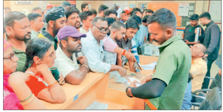
रिपोर्टर-सर घर में शादी है, दो कमर्शियल सिलेंडर मिल जाएगा क्या?

एजेसी कर्मचारी-नहीं, कमर्शियल सिलेंडर की डिलीवरी बंद है। रिपोर्टर-सर ब्लैक में ही दे दीजिए। एजेसी कर्मचारी-ब्लैक में तो क्या, कार्ड लेकर आने पर भी नहीं दे सकते। रिपोर्टर-डेढ़ गुना दाम ले लीजिए। रिपोर्टर-कर्मचारी-भाई कुछ दिन इंतजार कीजिए, जल्द ही स्थिति सामान्य हो जाएगी।