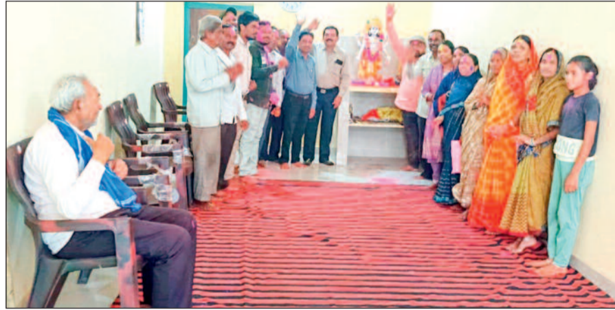
हरिभूमि न्यूज >>> धमतरी

झरिया महार समाज द्वारा होली मिलन समारोह का आयोजन किया गया। कार्यक्रम में समाज के लोगों ने एक-दूसरे को गुलाल लगाकर आपसी भाईचारे व सामाजिक एकता को मजबूत करने का संकल्प लिया।