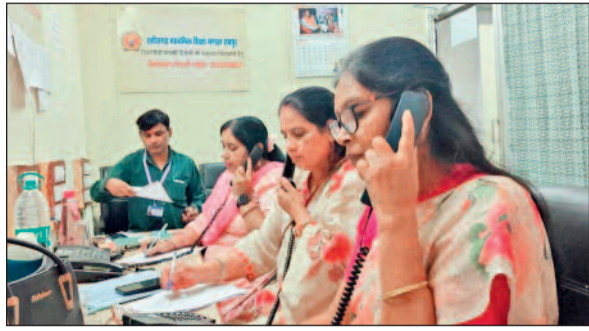
हरिभूमि न्यूज | धमतरी

बोर्ड परीक्षा समाप्त हो चुकी है। इस दौरान छात्र काफी कम्प्यूज भी हुए। राज्य स्तरीय हेल्पलाइन से उनका बेहतर ढंग से कम्प्यूजन दूर भी किया गया। शैक्षणिक, मनोवैज्ञानिक सहित अन्य तरीके से विशेषज्ञों ने समस्याओं का समाधान किया।